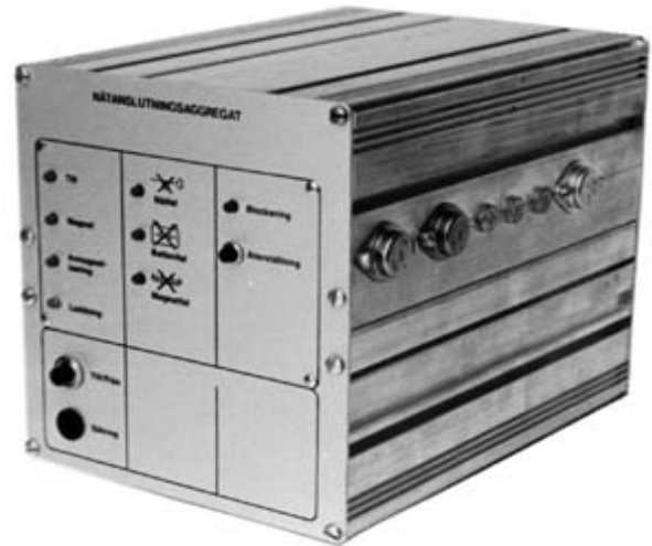
Nätaggregat med automatisk avmagnetisering.

Exempel på magnet med lastvakt. Lastvakten förhindrar att fritt hängande last frigöres oavsiktligt.